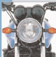
Ein sportlicher Scheinwerfer und große Blinker für bestes "Sehen" und "Gesehen-Werden".