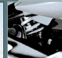
Die Hinterradaufhängung mit Zentralfederbein überzeugt durch erstklassiges Handling und hohen Fahrkomfort.