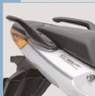
Abnehmbare Handgriffe bieten dem Sozius sicheren Halt.