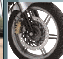
Eine Scheibenbremse mit 296 mm Durchmesser vorne gewährleistet eine gute Bremsleistung. Die ABS-Version verfügt über eine Dreikolbenbremszange.